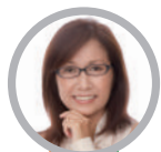
香山 リカ 精神科医・立教大学教授