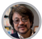
きむら ゆういち 絵本作家