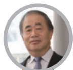
角川 歴彦 株式会社KADOKAWA 取締役会長