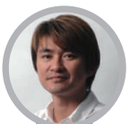
水口 哲也 クリエイター、プロデューサー 慶應義塾大学大学院 メディアデザイン研究科 (Keio Media Design) 特任教授