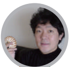
茂木 健一郎 脳科学者・ソニーコンピュータ サイエンス研究所シニアリサーチャー 慶應義塾大学特任教授